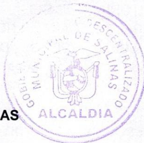
Oswaldo Daniel Cisneros Soria ALCALDE DEL CANTON SALINAS

Sancionó la presente ORDENANZA DE ALINEACIÓN DEL PLAN DE DESARROLLO Y ORDENAMIENTO TERRITORIAL DEL GOBIERNO AUTÓNOMO DESCENTRALIZADO MUNICIPAL DEL CANTÓN SALINAS CON EL PLAN NACIONAL DE DESARROLLO 2021-2025 , el señor Oswaldo Daniel Cisneros Soria, Alcalde del Cantón Salinas, a los veinticuatro días del mes de febrero de dos mil veintidós.